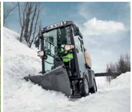
MIC 42, Einscharschneepflug