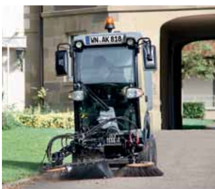
MIC 34 C, Wildkrautbesen