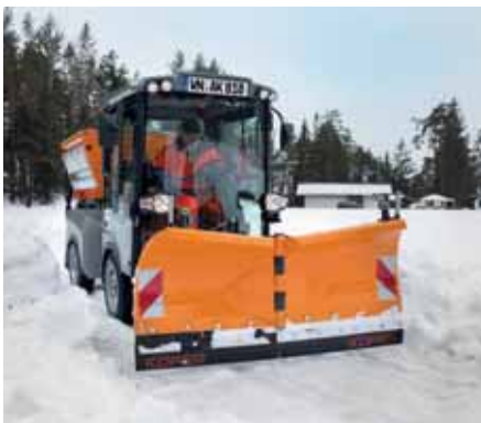
MC 130, Vario-Schneepflug