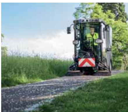
MC 80, Kehrsystem