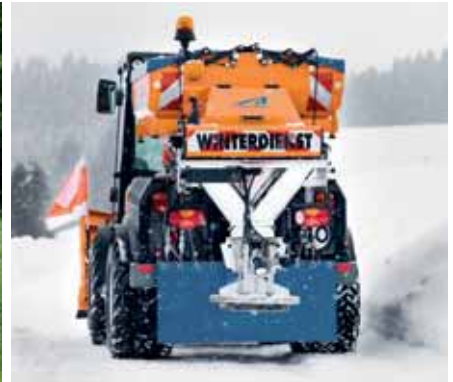
MIC 84, Aufbaustreuer