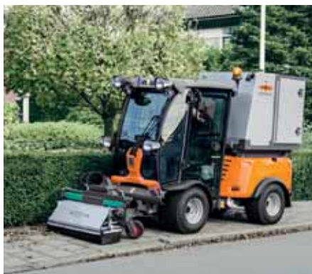
MIC 50, Wildkrautbeseitigung