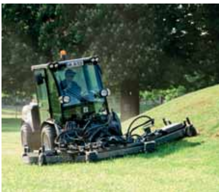
MIC 84, Sichelmäher