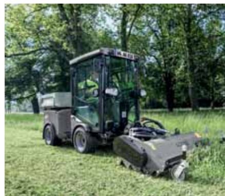
MIC 42, Schlegelmäher