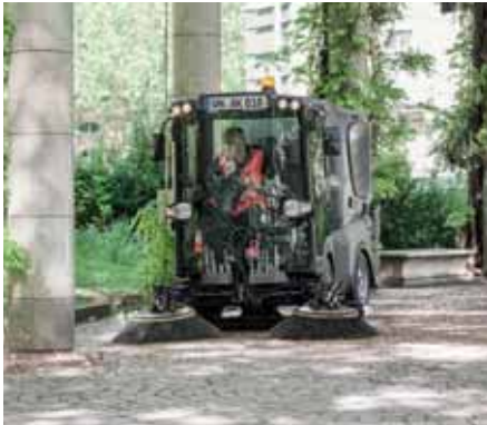
MC 130, Kehren