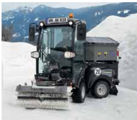
MIC 34 C, Winterdienst