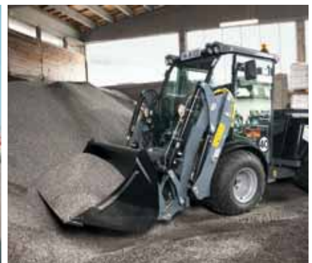
MIC 84, Frontlader