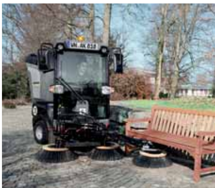
MIC 34 C, Kehren