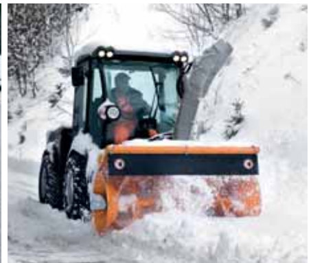
MIC 84, Schneefräse