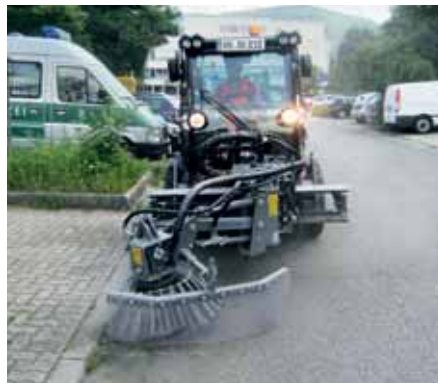
MIC 84, Wildkrautbesen