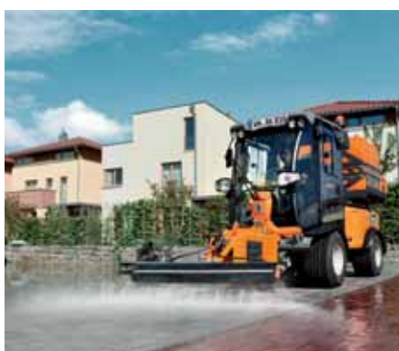
MIC 50, Schwemmsystem