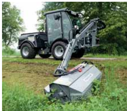
MIC 84, Frontausleger