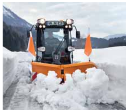
MIC 50, V-Pflug