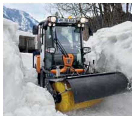
MIC 50, Frontkehrmaschine