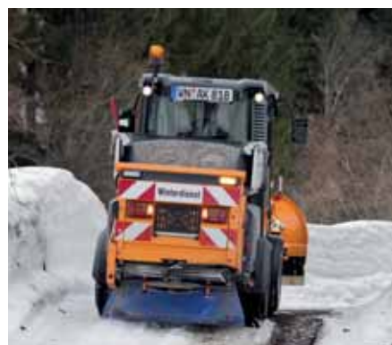
MIC 50, Anhängestreuer