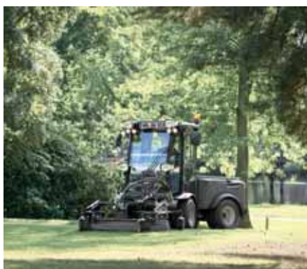
MIC 50, Sichelmäher