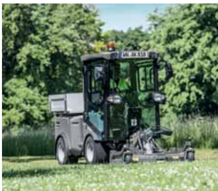
MIC 42, Sichelmäherwerk