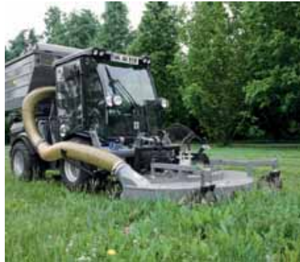
MIC 84, Mäh-Saug-Kombination