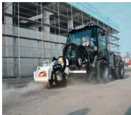
MIC 84, Asphaltfräse