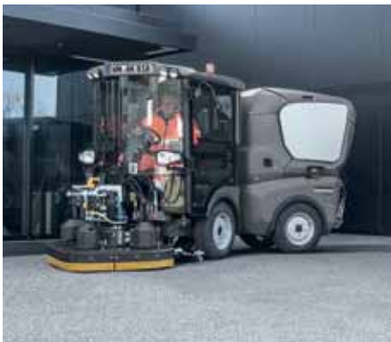
MC 130, Schrubbdeck